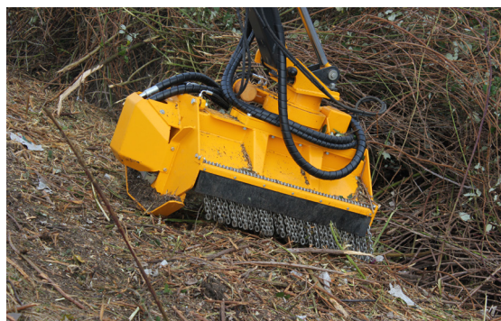
Voor de veiligheid is de bosbouwmaaier aan de achterzijde voorzien van een zwaar kettingscherm.