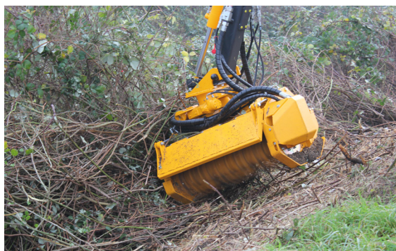
Een sterke motorkap en een (gesloten) hydraulisch opklapbare voorzijde.