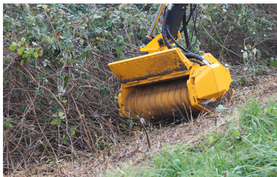
Hier getoond met een geopende hydraulisch opklapbare voorzijde zodat hoger struikgewas beter ingevoerd kan worden.