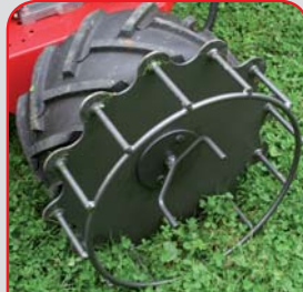
RoughCutter mit Gitterrädern für Halt am Hang