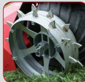
Stachelwalzen als Option bei Alpin