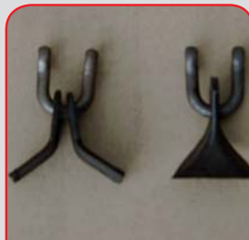
Schlegelwelle wahlweise mit Grobschnitt- (Y-) oder Feinschnittschlegel