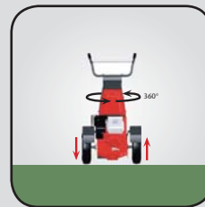
Hydro-Pro Lenkung - Zero Turn (ab RCH 1480 G)