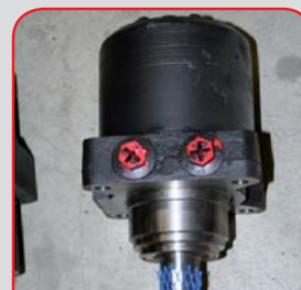
Verstärkte Radmotore bei Alpin