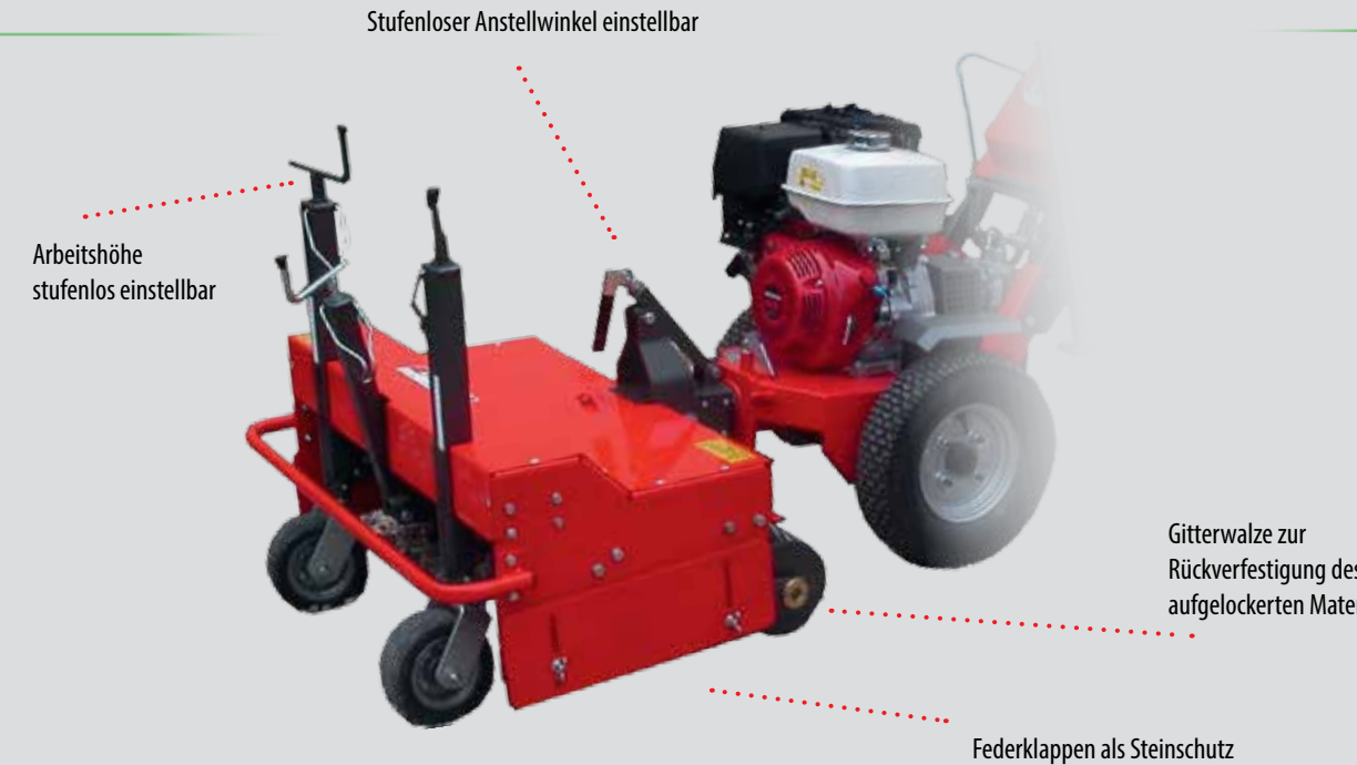
Stufenloser Anstellwinkel einstellbar

Wildkrautbürste zur einfachen Bekämpfung von Wildkraut auf gepflasterten Flächen, speziell an Rand- und Bordsteinen