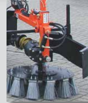
UB 5070 zum Anbau an einen Schlepper