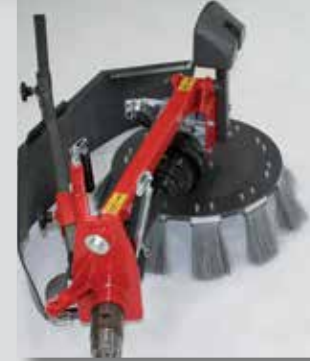
Wildkrautbürste für Einachser

Durch ein Höchstmaß an Flexibilität und Variabilität bieten wir für eine Vielzahl von Trägermaschinen die passenden Maschinen zum geforderten Einsatz.