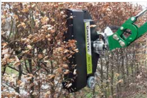
Heckenschneider RC 102

GreenTec bietet die größte Auswahl an Arbeitswerkzeugen für Ausleger auf dem Markt an. Sehen Sie mehr auf www.GreenTec.eu