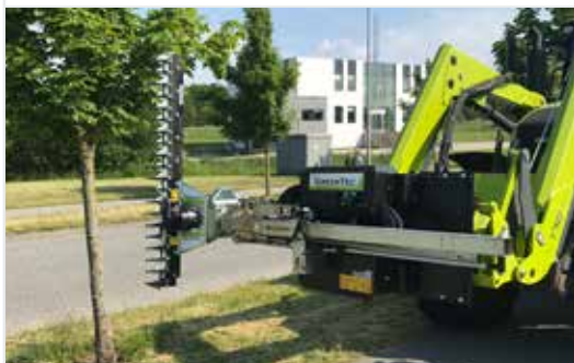
Heckenschere HL 152