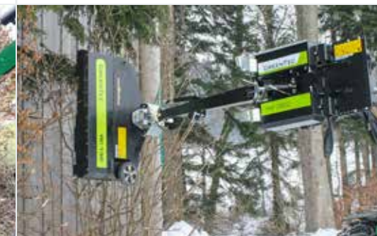
Heckenschneider RC 132