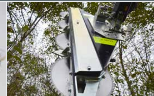
Astsäge LRS 1602