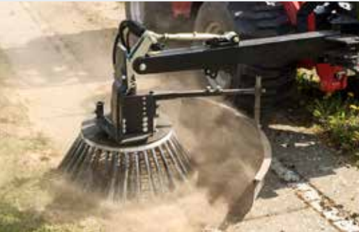
Wildkrautbürste BR 70