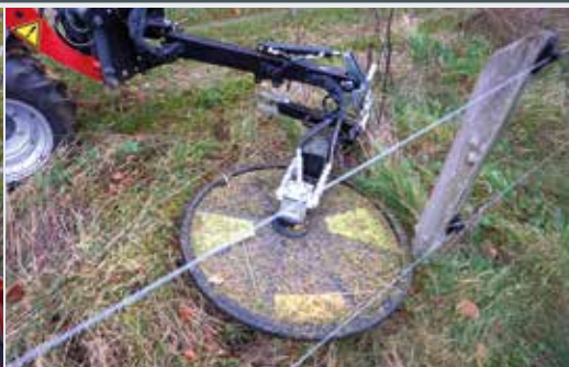
Zaunmäher RI 60 & 80