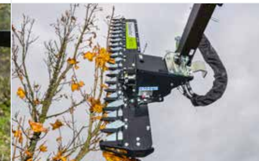
Ast-/Heckenschere HS 172