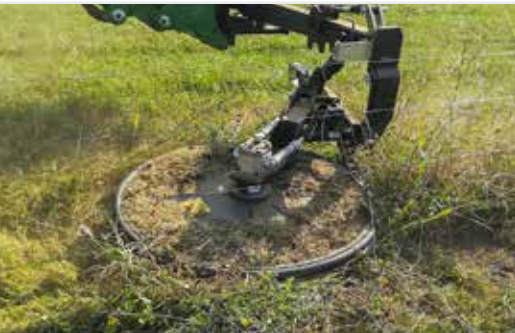
Zaunmäher RI 60 & 80