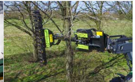
Astschere HX 170 & 230