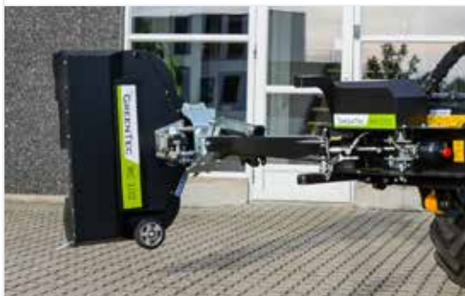
Heckenschneider RC 102

GreenTec bietet die größte Auswahl an Arbeitswerkzeugen für Ausleger auf dem Markt an. Sehen Sie mehr auf www.GreenTec.eu