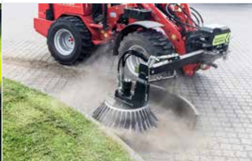
Wildkrautbürste BR 70