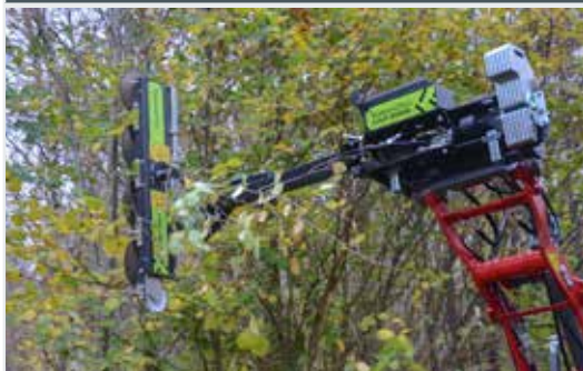
Astsäge LRS 1402