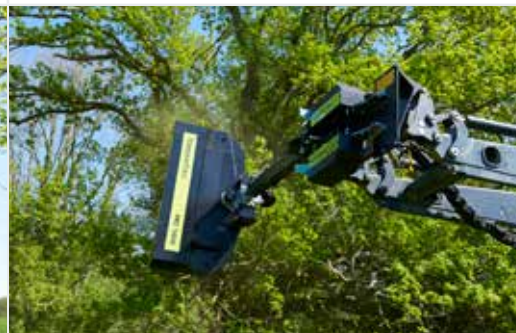
Heckenschneider RC 162