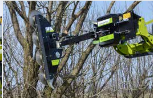
Astsäge LRS 2002