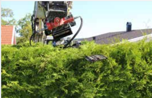
Heckenschere HL 182 & 212