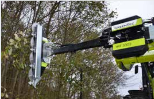
Astsäge LRS 1602