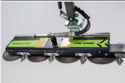
Astsäge LRS 1402