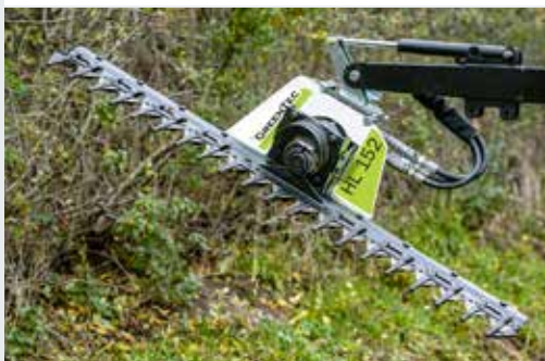
Heckenschere HL 152 - 212