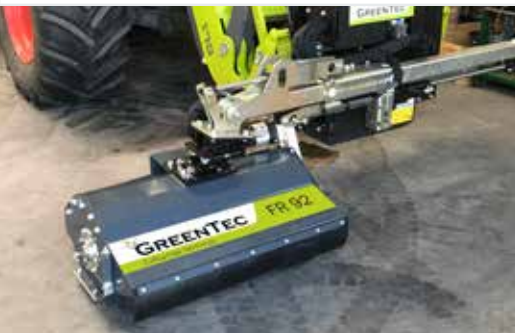
Schlegelmulchkopf FR 92*