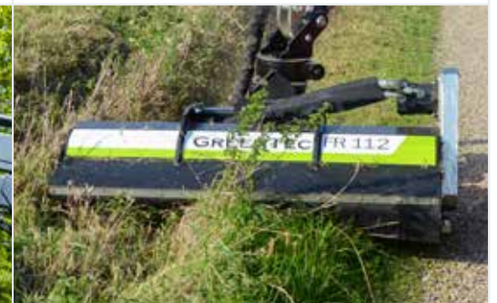
Schlegelmulchkopf FR 92 & 112*