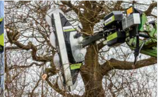
Astsäge LRS 2402