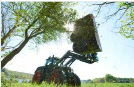
Heckenschneider RC 132